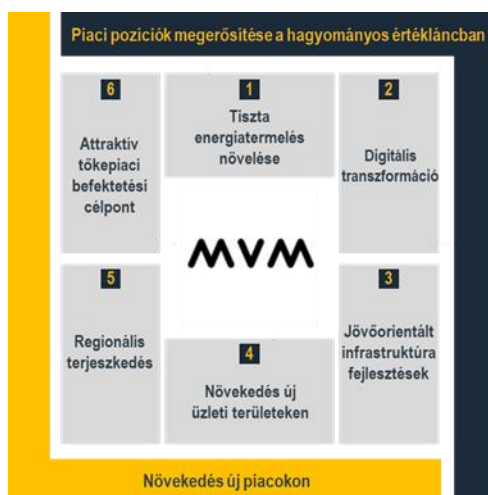
Az MVM Csoport Stratégia 6 pilléres keretrendszere

A jövőképből leképezett stratégia kifejezetten a növekedést célozza meg, ami azonban elképzelhetetlen a hagyományos üzleti területeken való megújulás nélkül. A hazai piacon az organikus növekedés lehetősége korlátozottá vált a hagyományos tevékenységeinkben a piaci részesedéseink és a rezsicsökkentés feltételrendszere miatt, dinamikus növekedés így regionális terjeszkedésen és új üzleti területekre való belépésen keresztül érhető el. A dinamikus növekedés két szempontból fontos: egyrészt azért, hogy a piaci pozícióit meg tudja tartani és versenyképes legyen az új üzleti területeken mai és leendő versenytársaival szemben is, másrészt, hogy a jövőbeli befektetéseit/beruházásait fenntarthatóan finanszírozni tudja. Középtávon a tőzsdére lépés feltételeinek megteremtésével ezt a célt kívánjuk támogatni, a tőkepiaci megjelenés ugyanis több benchmark energiavállalat esetében bizonyult hatékony forrásbevonási, illetve reputációt és hatékonyságot növelő eszközhöz.