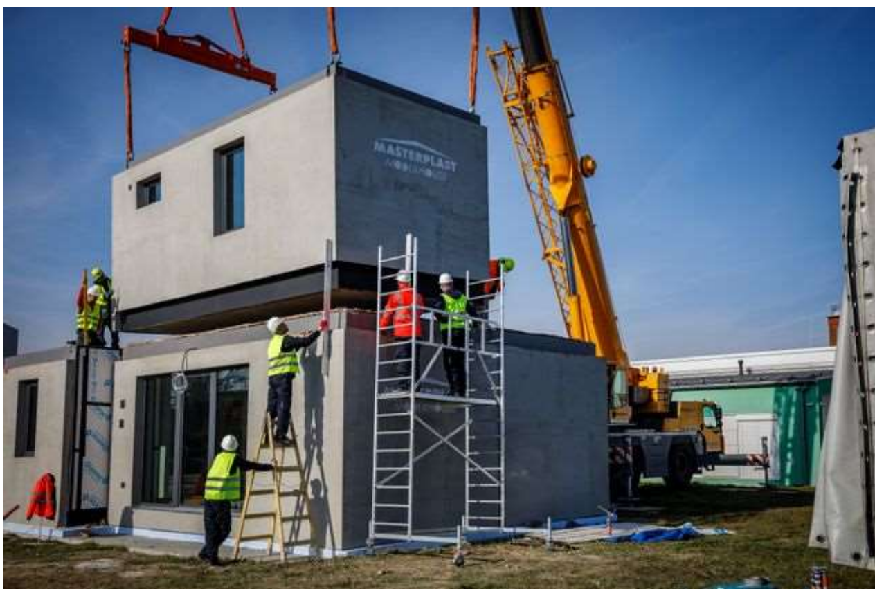
Masterplast Modulhouse építkezés

A kisebb szlovák és horvát piacokon 2026 első negyedében a rendelkezésre álló adatok alapján eltérő folyamatok látszóttak. Szlovákiában a statisztikai hivatal szerint januárban az építőipari termelés 2,0%-kal csökkent éves alapon, februárban viszont 8,2%-kal nőtt, ami a hazai építőipari aktivitás javulásához, azon belül út- és vasútépítési munkákhoz kapcsolódott. Horvátországban a Horvát Statisztikai Hivatal (DZS) februári adata szerint az építési munkák volumene munkanaphatással kiigazítva 3,4%-kal nőtt éves alapon, miközben a kiadott építési engedélyek száma februárban 722 volt, ami 25,5%-os éves csökkenést jelentett.