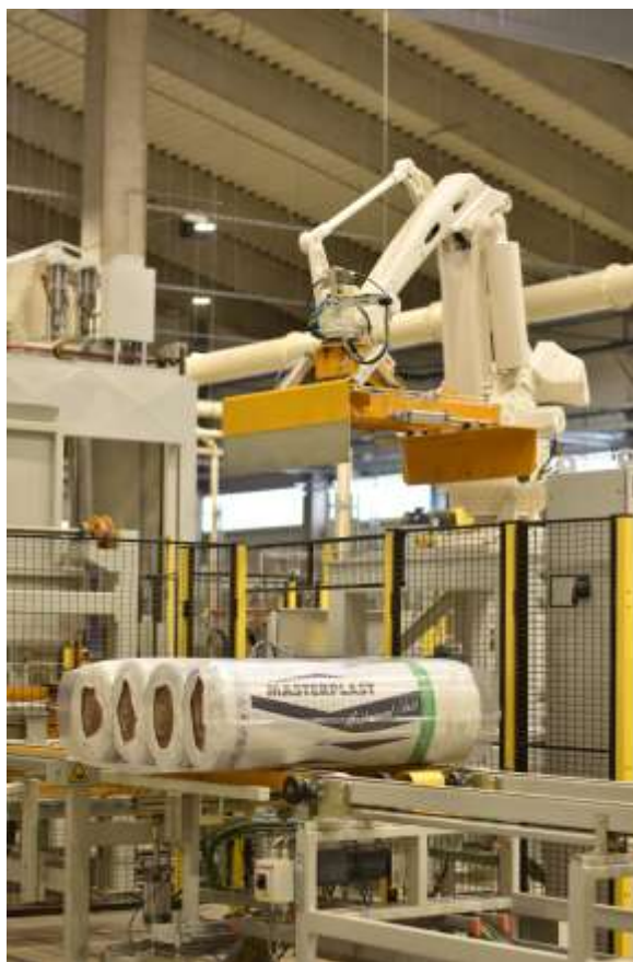
A szerencsi új üvegyapot gyár már termel

A Vállalat jelentős értékben valósított meg gyártásfejlesztő beruházásokat az elmúlt években. Nagymértékben növelte kapacitásait az üvegszövet és diffúziós tetőfólia gyártásban, mellyel a legmagasabb minőségi igényű, prémium kategóriás termékek piacát is képes kiszolgálni a Cégcsoport. EPS, XPS és immáron működő üvegyapot gyártó egységei lehetővé teszik, hogy a Masterplast olyan hőszigetelőanyag- gyártóvá fejlődjön, amely mind a műanyag, mind az ásványi szigetelőanyagok terén jelentős gyártói és piaci pozíciókkal rendelkezik. A frissen optimalizált, széles körű gyártási portfólió, valamint a fentiekben vázolt, strukturálisan is alátámasztott piaci kereslet stabil alapot teremt a Társaság számára a következő években, hogy jövedelemtermelő képessége tovább erősödjön.