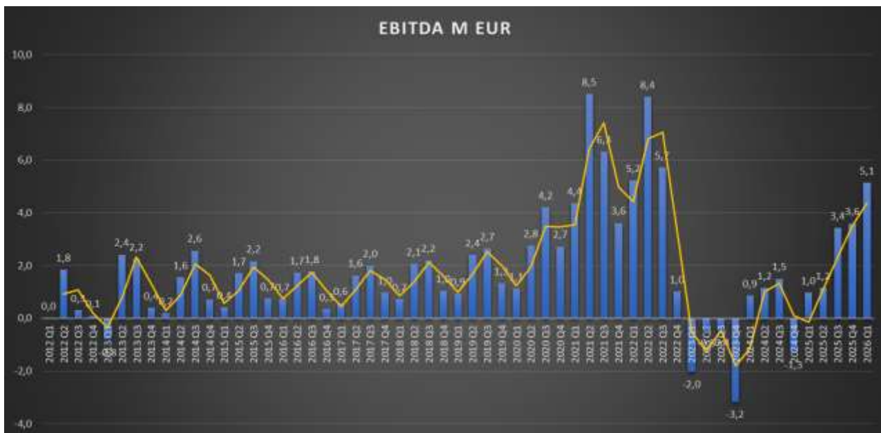
Forrás: a Csoport IFRS szerinti, konszolidált, auditált és nem auditált beszámoló